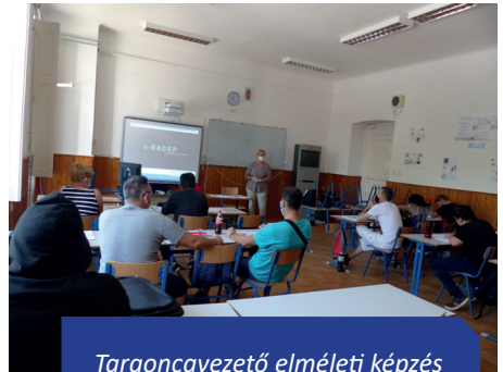
Targoncavezető elméleti képzés