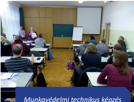
Munkavédelmi technikus képzés