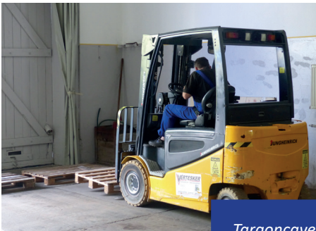
Targoncavezető gyakorlati képzés